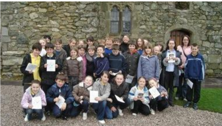
Bu plant Blynyddoedd 5 a 6 yn ymweld a Neuadd Cochwillan, sef cartref yr Archesgob John Williams sydd wedi ei gladdu yn Eglwys Llandygai. (Gweler Hanes - Sant Tegai)