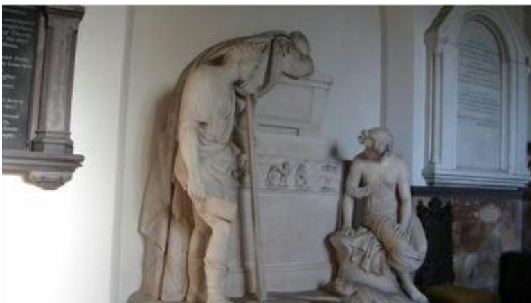
Plant blwyddyn 3 a 4 yn ymweld a'r Eglwys i drafod Richard Pennant fel rhan o'u thema.